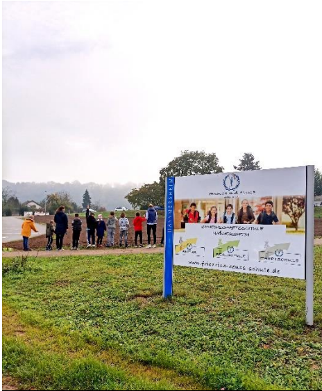
Aussaataktion Haßmersheim am 19.10.2023

Die Gemeinde Haßmersheim beteiligt sich am Projekt „Blühender Naturpark“ mit einer über 1.700 Quadratmeter großen Wildblumenwiese auf dem Gelände der Friedrich-Heuß Gemeinschaftsschule. Am 19.10.2023 nahmen Schülerinnen und Schüler aktiv an einer Aussaataktion teil, um frühzeitig mit dem Thema Biodiversitätsverlust und der Rolle der Insekten vertraut zu werden.