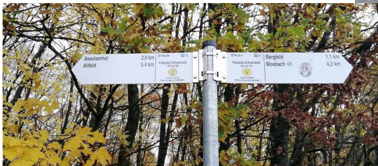
Zielorientierte Wanderwegweisung in Mosbach / Elztal